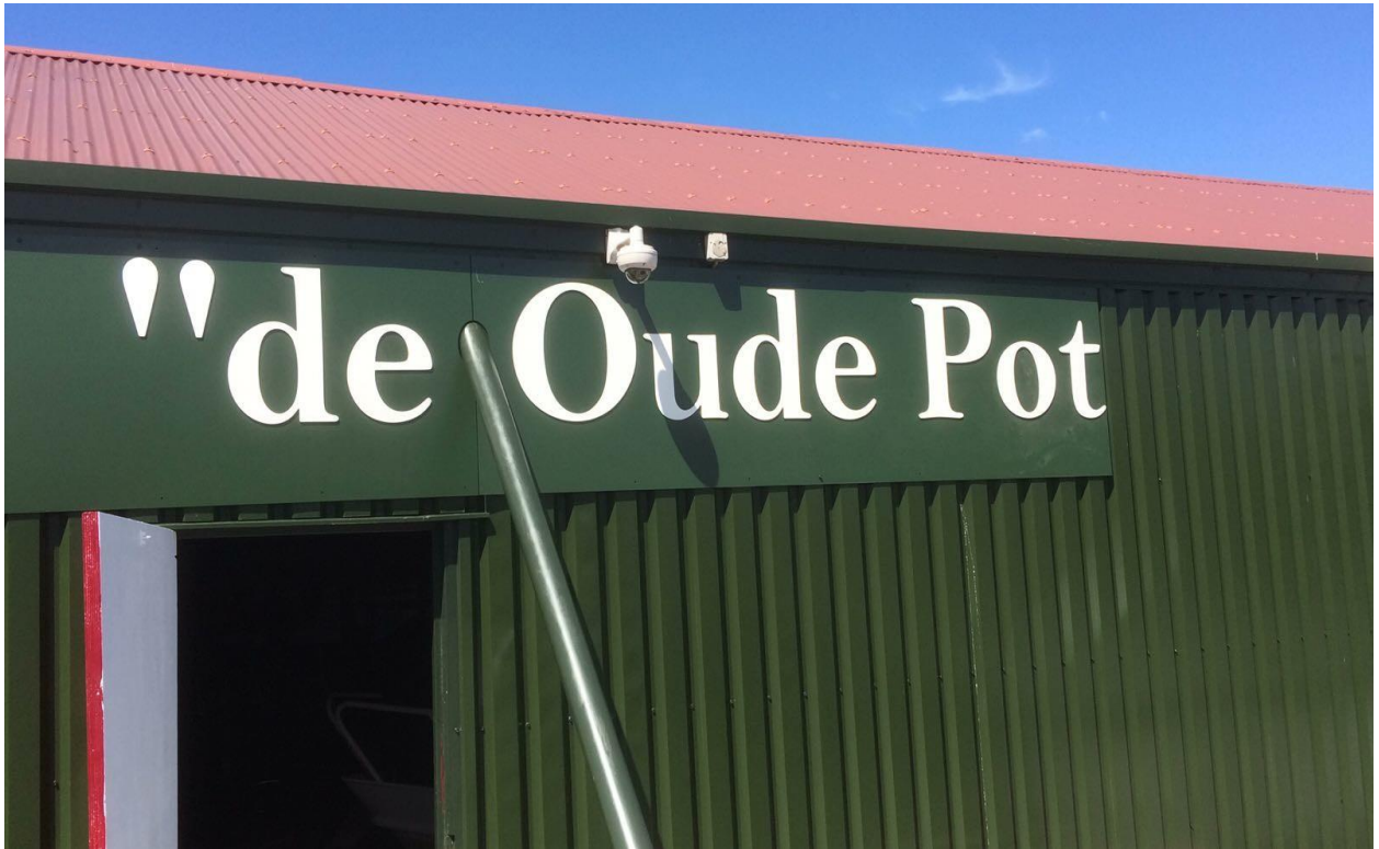
De reclame is aangebracht..... nee toch niet helemaal af