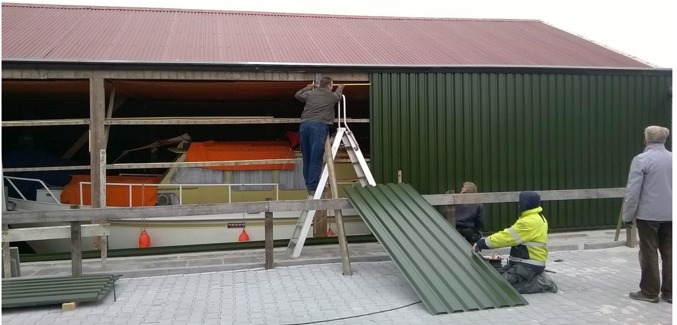
Wand van de 14 meter schiphuizen is recht gezet, damwandbeplating wordt aangebracht