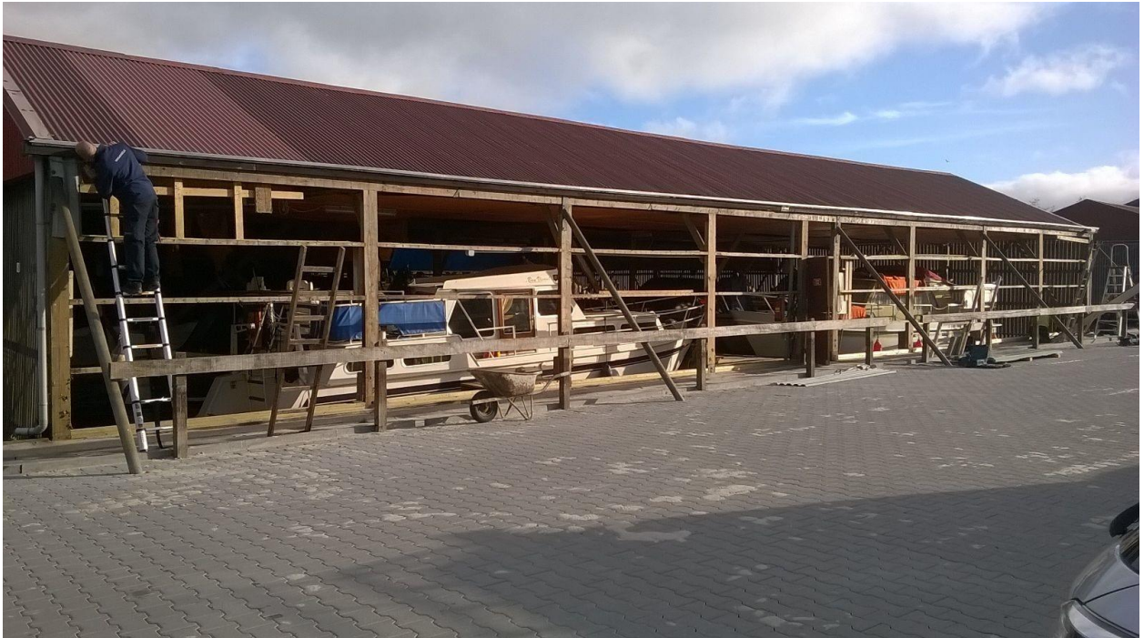
Wandbekleding van de 14 meterschiphuizen is verwijderd