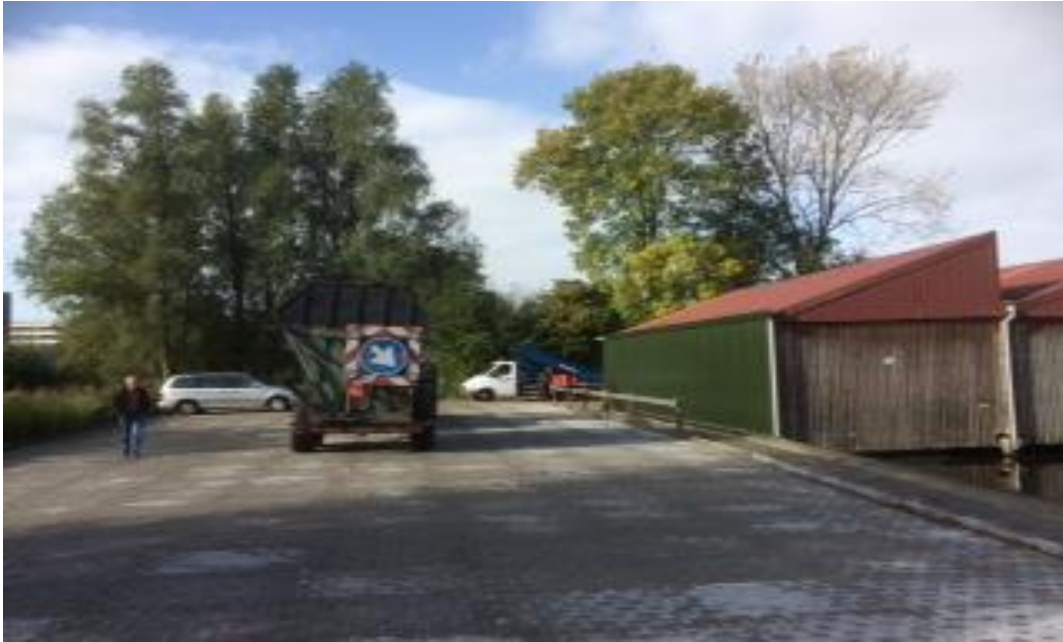
Zo was de situatie

Is het jullie al opgevallen dat er een aantal bomen missen aan de kant van onze buurman het Waterschap?