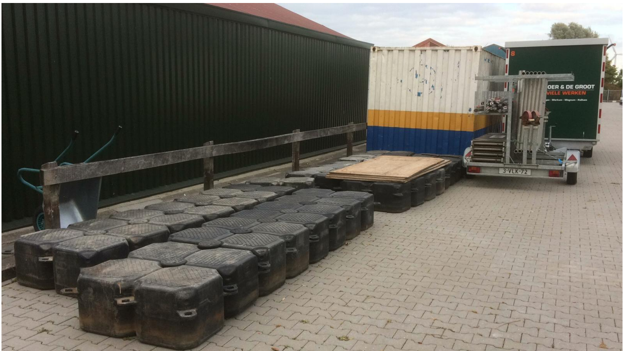
De pontons om vanaf het water de werkzaamheden te kunnen uitvoeren liggen klaar