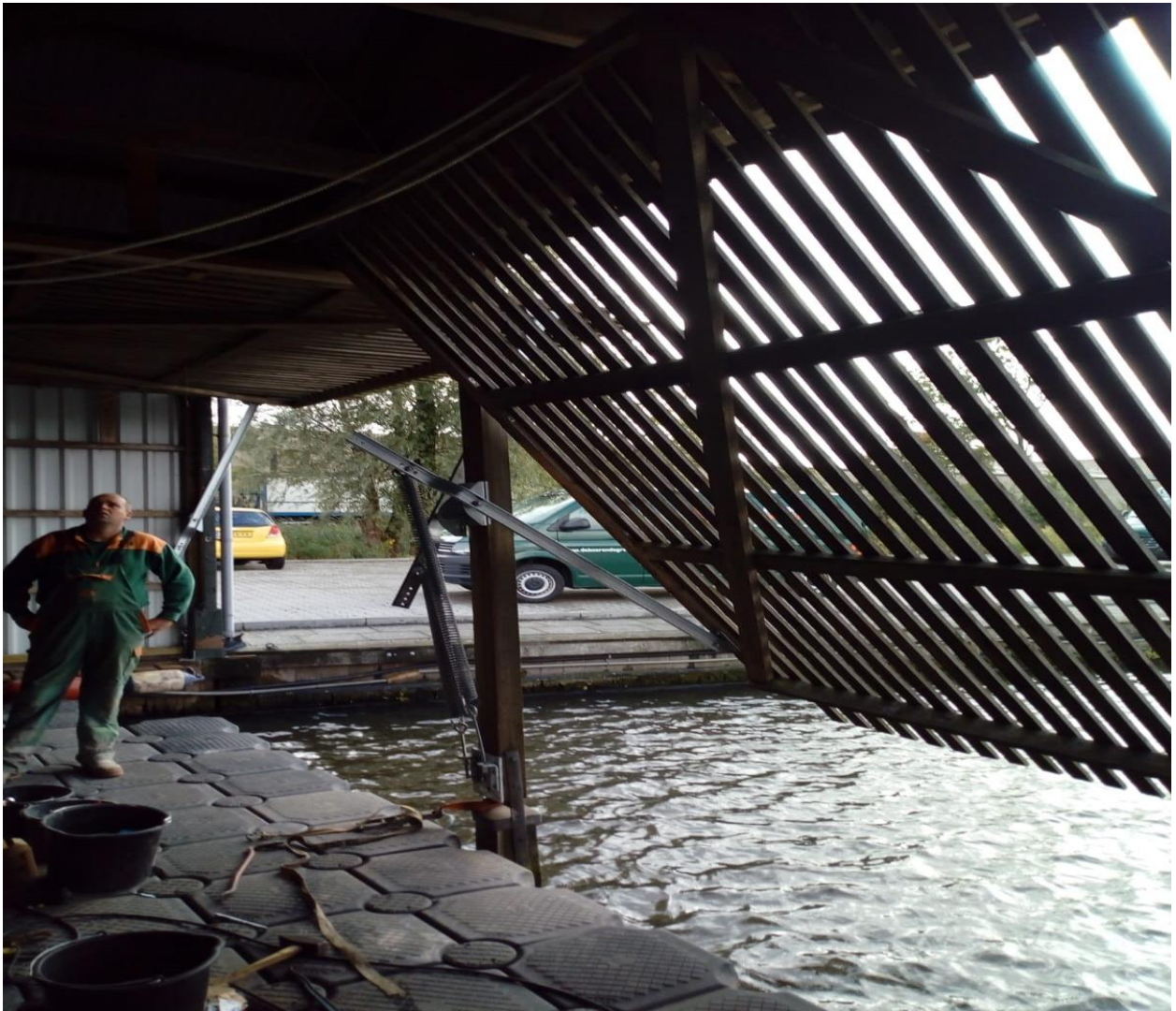
Maandag begonnen. Na wat voorbereidingswerk dinsdag de 1 e twee schiphuisdeuren gereed.