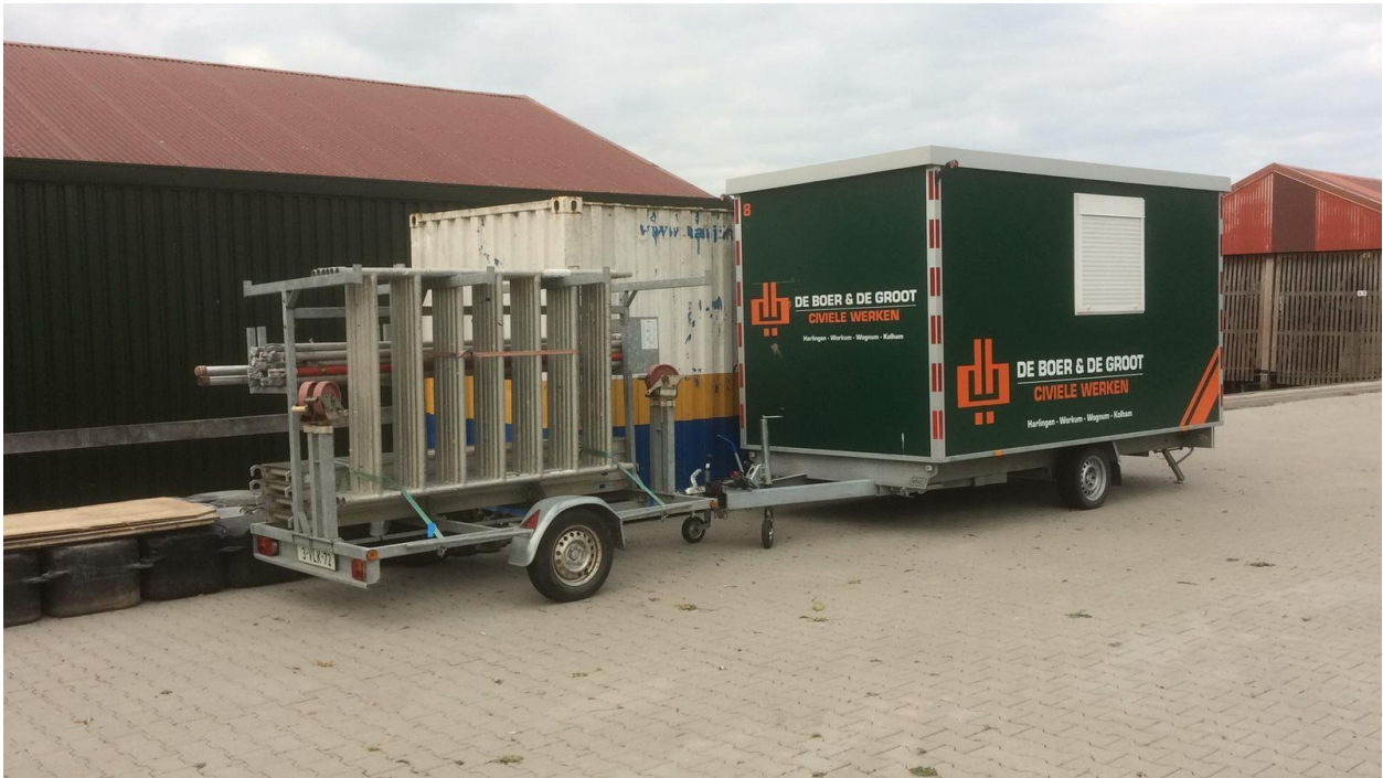
De Boer & de Groot zal de montage uitvoeren.