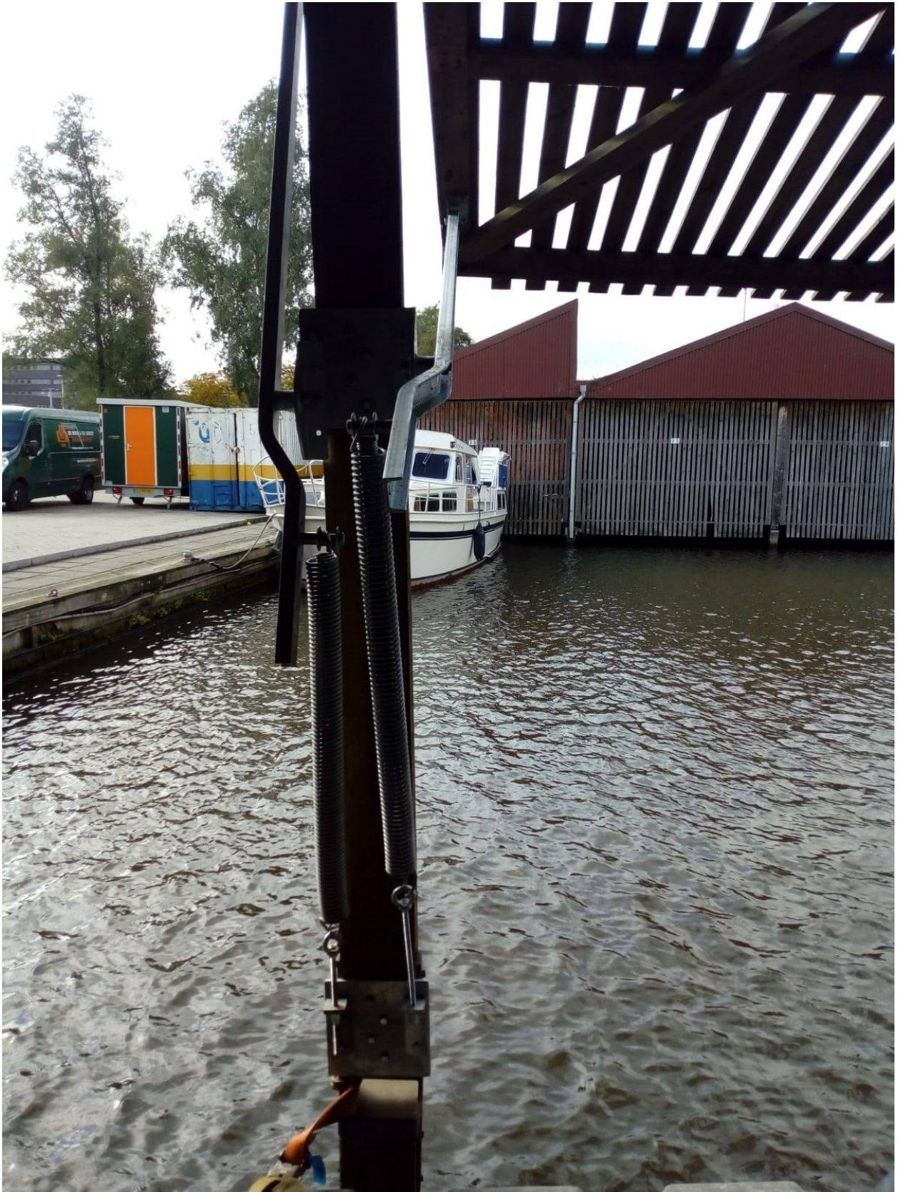
Het nieuwe draai- en sluitwerk met bijbehorende veren aangebracht.